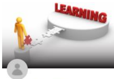
Lean Training (Bronze) - Ro...